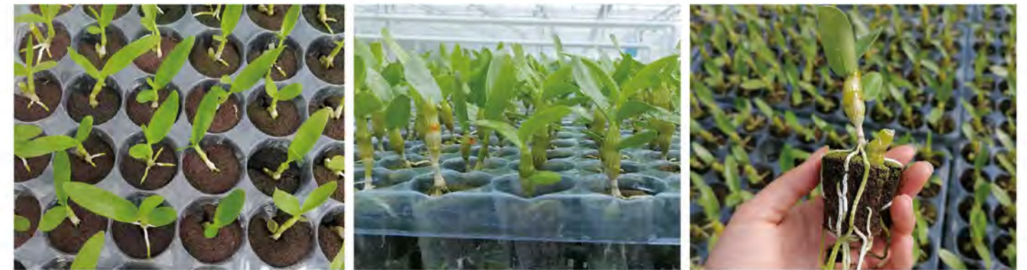
春石斛插穗使用圃樂格育苗，根系生長均勻一致。

Quick Plug B.V. 公司希望未來在台灣也能完整提供這樣的服務，所以找上同樣擁有介質技術與栽種經驗的大漢公司作為其台灣合作夥伴。因為我們兩家公司都瞭解，回應我們客戶的需求，是一件多麼重要的事情。